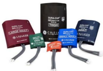
Младенческая манжета 8-13 см