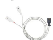
Датчик универсальный LNCS Y-I