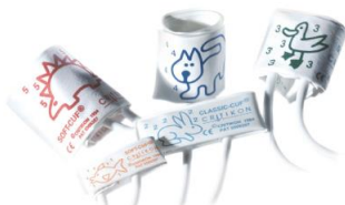
Манжета 3-6 см № 1