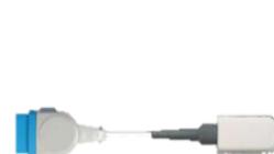
Кабель Masimo LNCS 2027263-002